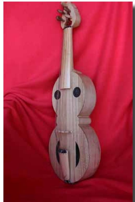
Fídula en ocho